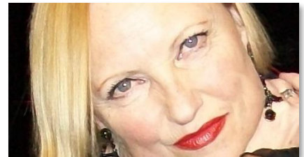
Anna Haentjens: „Juliette Gréco“ | 25.11.