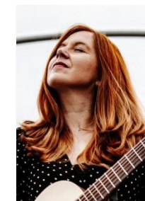
Gunst | 10.5.