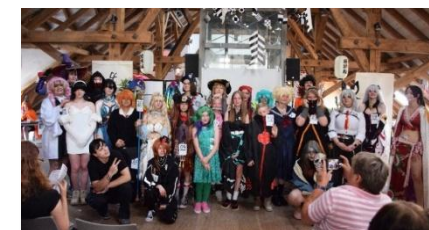
Animenacht | 20.6.