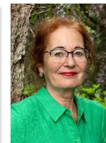
de Vries | 21.5.