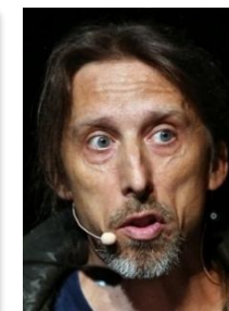
Rudloff | 23.4.