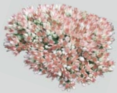
„Fetthenne“ Staupe des Jahres 2011 Bund deutscher Staudengärtner